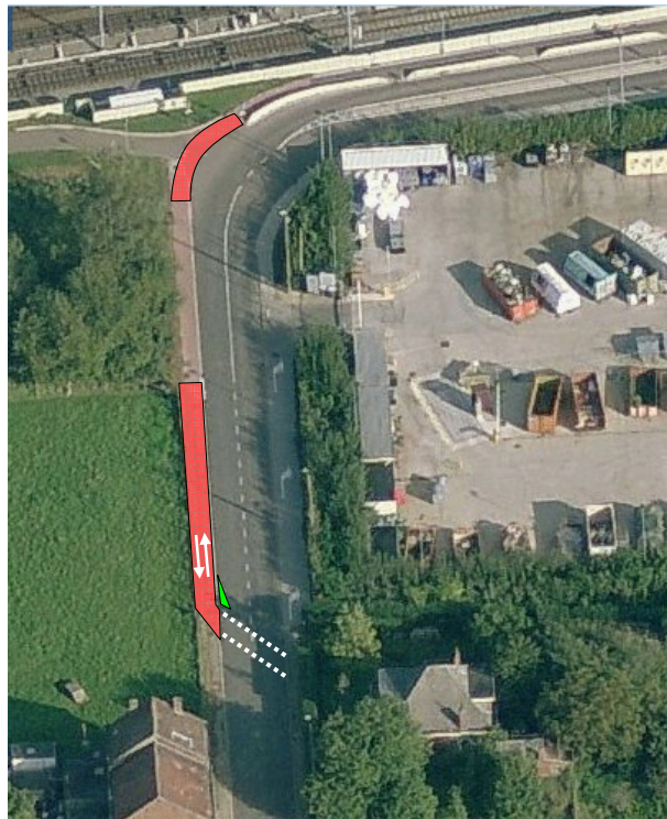
foto 1. kruispunt Koutersstraat x Spoorwegstraat

Het voorstel is om deze strook minstens te verlengen tot voorbij het begin van de afslagstrook naar het containerpark en de strook duidelijk te markeren als dubbelrichtingsfietspad. Vóór de afslagstrook moet een duidelijk gesignaleerde fietsoversteek aangegeven worden.