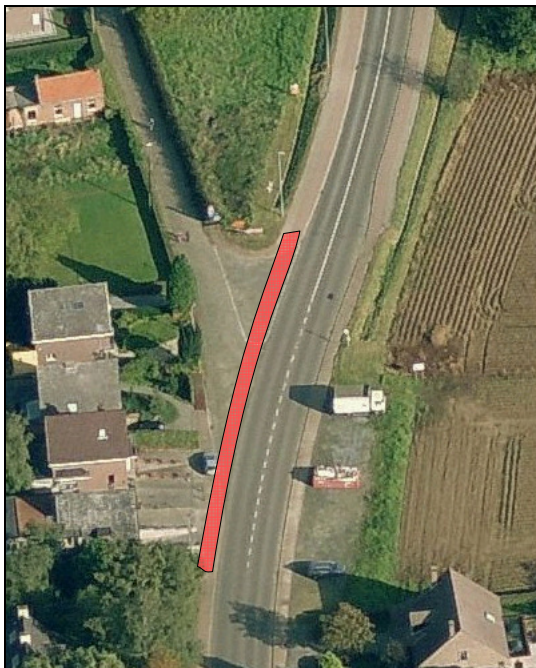
foto 2. kruispunt Rijweg x Kleine Molenweg

Het is aangewezen een doorlopend fietspad te voorzien waar nu kasseien liggen en beter te signaleren of er verder langs de Rijweg al dan niet een fietspad dan wel voetpad ligt (foto 2). Indien dit een fietspad is, dient ook in de bocht t.h.v. de Schotstraat een doorlopend fietspad voorzien worden (foto 3).