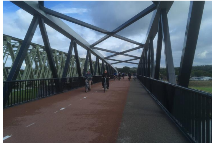
Fietsbrug naast spoorwegbrug Cuijk - Nederland

Via een ruil van gronden probeert de gemeente het probleem van de grondverwerving op te lossen zodat het project van de fietsbrug en de fietsverbinding met de tramterminus eindelijk kan gerealiseerd worden.